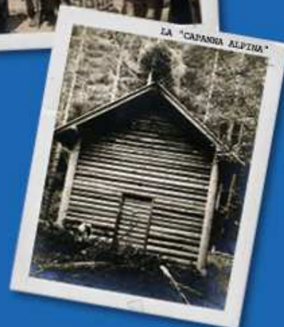
LA "CAPANNA ALPINA"