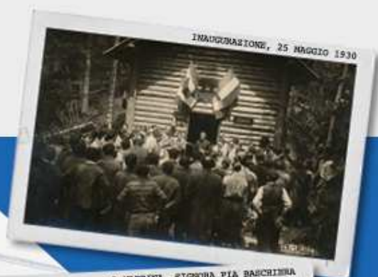
INAUGURAZIONE, 25 MAGGIO 1930